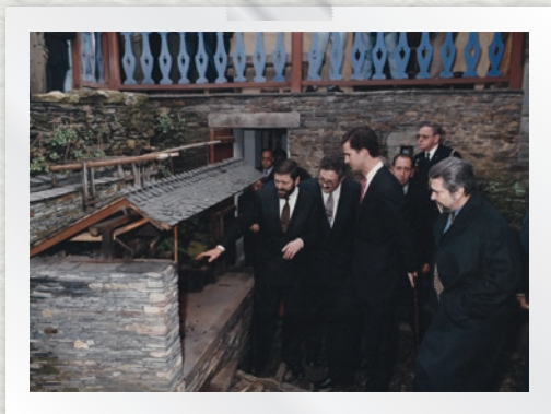
Na concesión del galardón Poble Exemplar d'Asturias á comunidade vecinal de Grandas de Salime en 1993.

A trascendencia social del Museo evidencia qu'é posible crear comunidad alrededor d'úa institución cultural. Úa comunidad que, como el Museo Etnográfico de Grandas de Salime "Pepe el Ferreiro", nun queda na materialidad das pezas nin se pecha nos límites das súas instalacións. Úa institución que tece redes de pertenencia y identidad. Un museo que fortalece os vínculos d'úa comunidad qu'é quén a crear futuro col sou pasao.