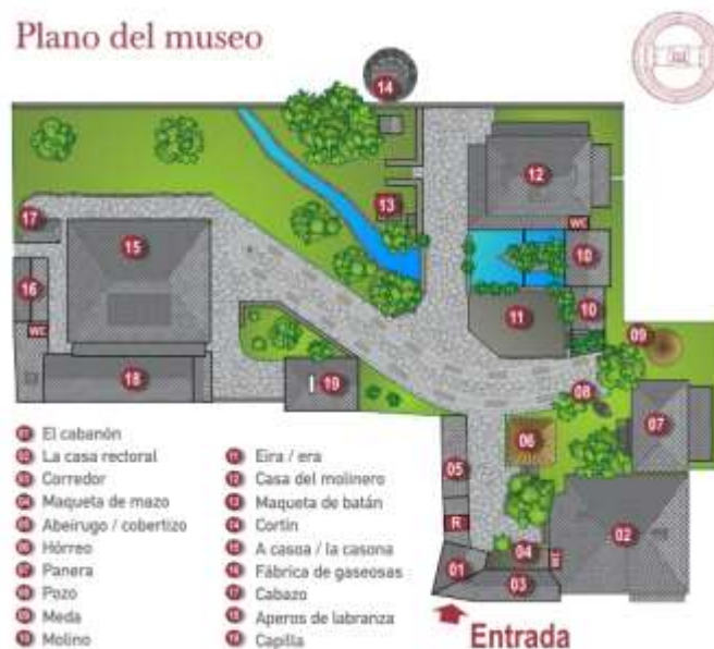
Plano del museo